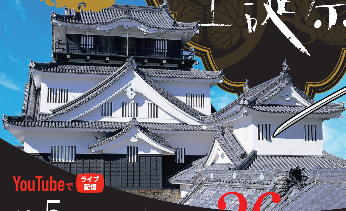
竹千代 家康公の幼名