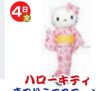
ハローキティまつりミニステージ