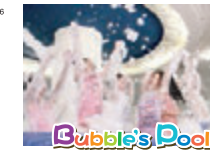
パブルマシンを使って泡のプールができます。

●バブルプール ●ランバイク & スケートボード試乗会 ●トランポリン(有料) ●花火教室 当日予約制 受付 17:00~(有料)