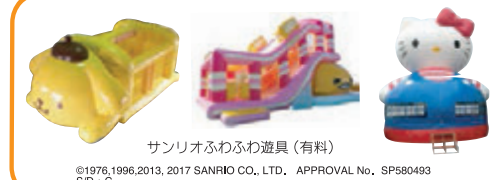
サンリオあそび玩具(有料)

●バブルプール ●ランバイク & スケートボード試乗会 ●トランポリン(有料) ●花火教室 当日予約制 受付 17:00~(有料)