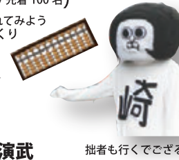
拙者も行くでござる

スマホばかり触れてないで、たまにはアナログ。そろばんに触れてみよう そろばんでダンス・そろばんの体験・そろばんストラップづくり